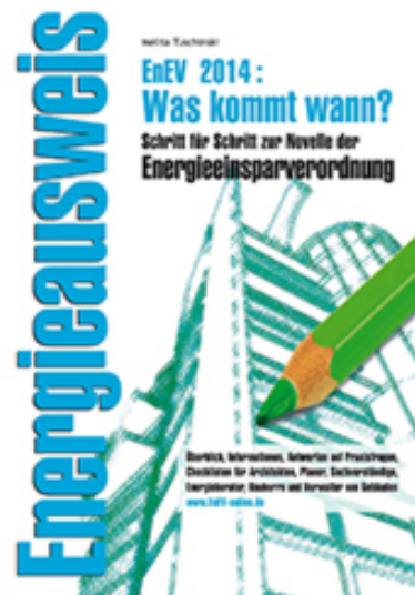
Praxishandbuch zur EnEV 2014