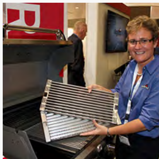
Char-Broil: Eine zusätzliche, fein gelochte Metallplatte macht den Unterschied. Der Char-Broil-Grill soll 30 % weniger Gas verbrauchen.