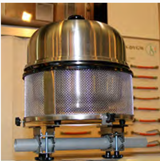
Cobb: Passt auf jeden Balkon, bzw. jedes Geländer und grillt mit Gas: der universelle Cobb-Grill.