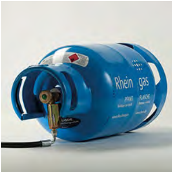
Komfortables Anschluss-System von Rheingas – jetzt auch für die 11-kg-Flasche für Treibgasstapler verfügbar

Das vom KlimaKreis Köln geförderte Projekt „Verringerung der CO 2 Emissionen und Kraftstoffkosten im Gütertransport durch die Verwendung von Dual-Fuel Systemen“ sieht den Einsatz und den Pilotbetrieb von LPG Dual Fuel Anlagen in Diesel Lkw vor. Dieses Projekt hat zum Ziel, dieselbetriebene Lkw mit LPG Dual Fuel Anlagen auszustatten und den Betrieb in einer sechsmonatigen Pilotphase unter unterschiedlichen Einsatzbedingungen zu testen. Weiterlesen [...]