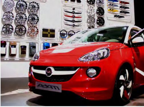
Opel Adam für Individualisten