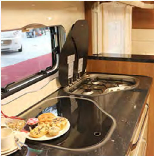
Komfortabel kochen auch unterwegs: Ein Gasherd gehört heutzutage schon zum Standard