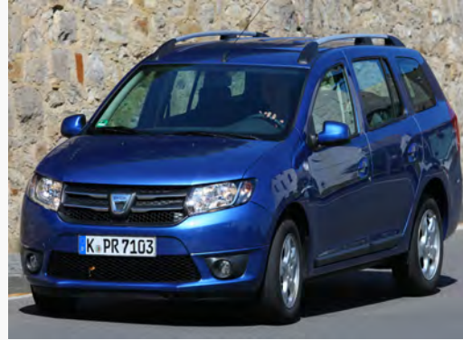
Dacia Logan MCV