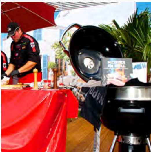
Matzek: Auf der Spoga gut besucht: Die Freiluft-Kochvorführungen