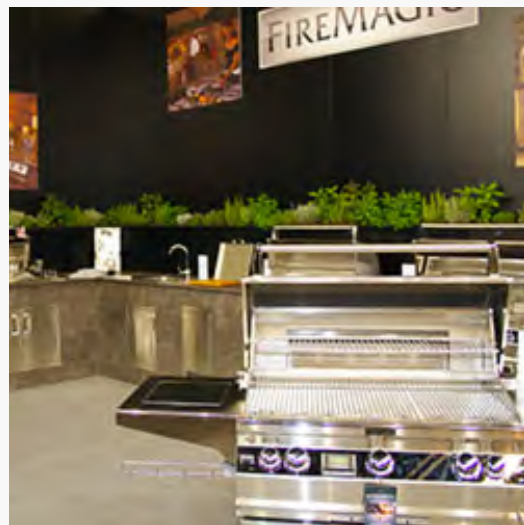
Fire Magic: Auf der nach oben offenen Preis- und Qualitätsskala nimmt Fire Magic die Spitzenposition ein.