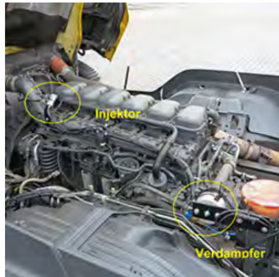
ISI GmbH: Dual Fuel System für LKW

Treibgas-Gabelstapler: Clip-On-Anschluss beschleunigt Flaschenwechsel