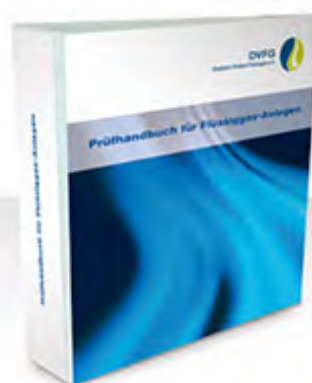
Prüfhandbuch für Flüssiggas-Anlagen, Hrsg. DVFG

Das neue Prüfhandbuch wird Anfang November 2013 erscheinen. Über die Website www.trf-online.de des WVGW Verlags können bereits Bücher vorbestellt und einzelne Inhaltsseiten angeschaut werden. Wie auch bei den Technischen Regeln Flüssiggas 2012 erhalten DVFG Mitglieder das Prüfhandbuch zu einem Vorzugspreis. Weitere Informationen [...]